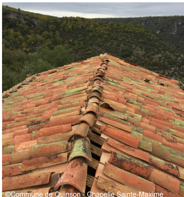
Chapelle Sainte-Maxime

OUI, je fais un don de .....€ pour aider à la restauration de la chapelle Sainte-Maxime de Quinson et je bénéficie d'une réduction d'impôt pour l'année en cours et j'accepte que mon don soit affecté à un autre projet de sauvegarde du patrimoine ou au fonctionnement de la Fondation du patrimoine, si le projet n'aboutissait pas dans un délai de cinq années après le lancement de la présente souscription conformément au dossier validé initialement par la Fondation du patrimoine, si la collecte dépasse la part restant à la charge du porteur de projet ou si celle-ci était inactive (absence d'entrée ou sortie de fonds) pendant un délai de deux ans.